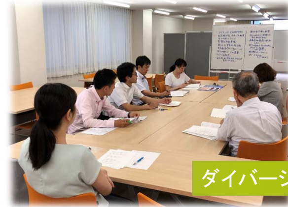
ダイバーシティ会議