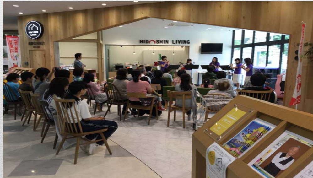
インスタブランチでのロビーコンサート