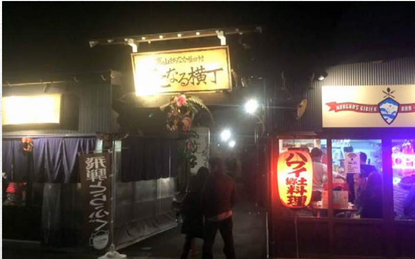
高山まちなか屋台村「でこなる横丁」