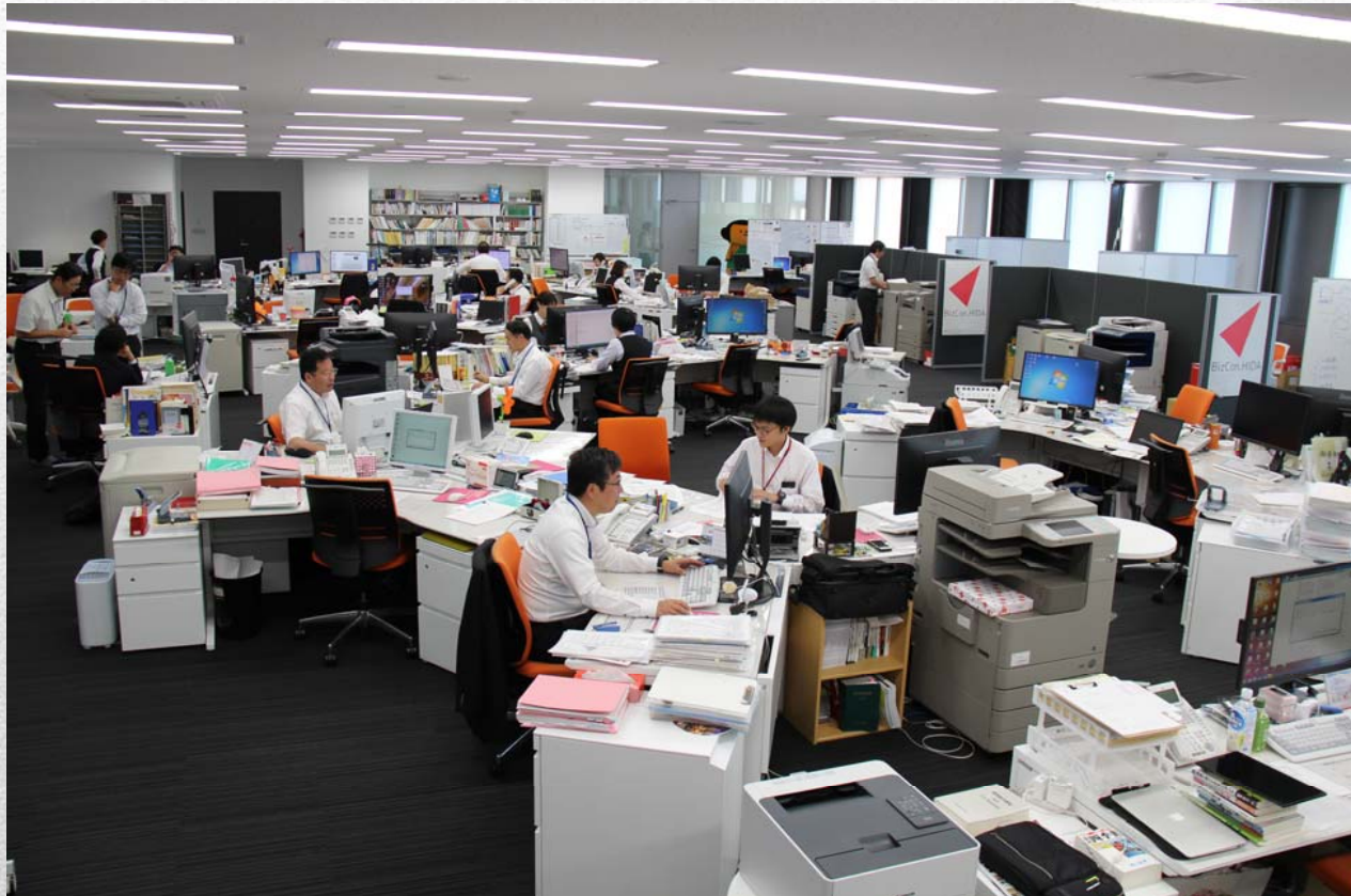
本部7部署を間仕切りの無い1つのフロアに集約