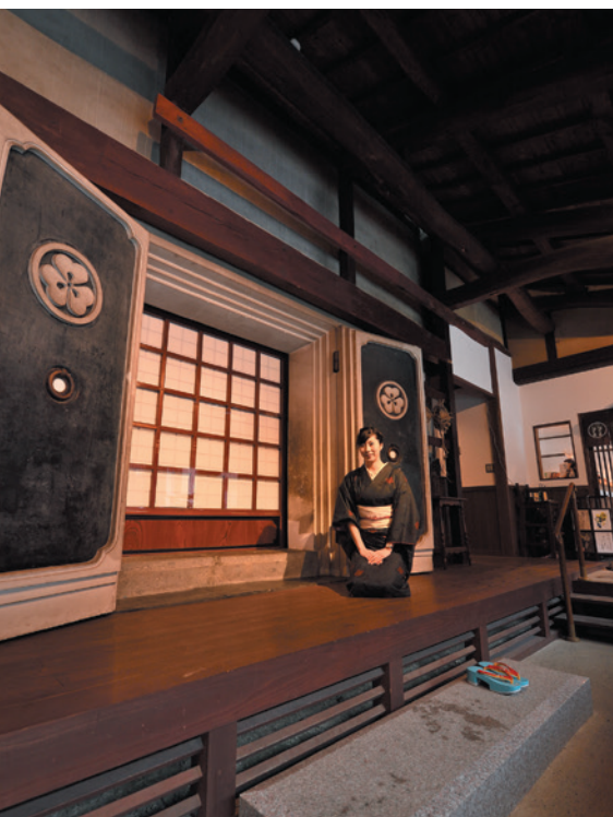
「越中八尾ベース OYATSU」の建物は、かつて「富山藩のお納戸」といわれるほど栄えた八尾の歴史を物語る。