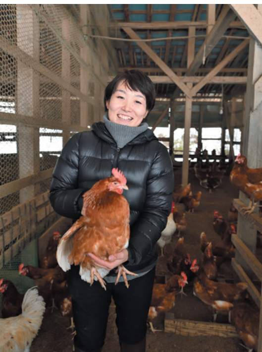
約1000羽の平飼いの鶏は、この地で栽培された飼料米などを配合して発酵させた飼料を食べて健やかに育ち、鶏のふんは水田や畑の肥料になる。