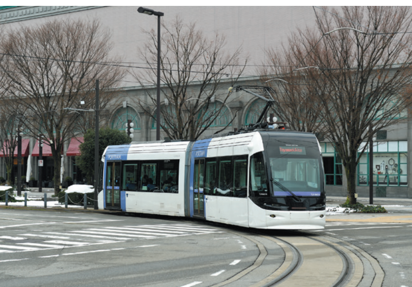
富山駅と岩瀬地区を結ぶ、日本初のLRT「富山ライトレール（愛称ポートルム）」。車体がモダンなデザインで目を引く一方、高齢者でも利用しやすい構造になっている。

独自の取り組みは他にも多く、全国からの視察も絶えない。各地の家庭に薬が届けられたように、富山の「当たり前」はやがて、各地にも広まるのではないだろうか。