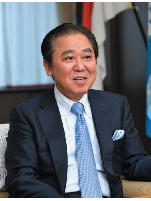
富山ライトレールの整備およびコンパクトシティ事業の成果により、2010年国土交通省交通文化賞を受賞した富山市長森雅志氏。『森のひとりごと』（北日本新聞社）等の著書で、画期的なアイデアの一端にふれられる。