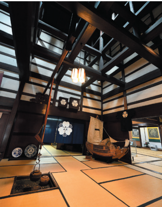
1878年に建てられた岩瀬の「北前廻船問屋森家」は一般公開されており、贅を尽くした造りに隆盛期の面影をたどれる。国指定重要文化財。

「外出して誰かと話をして健康寿命が延びれば、医療費や介護保険料の増加を抑えられます。市民が健康になるなら、七千万円ほどの補助金も惜しくはありません」