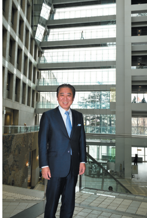
市庁舎は地上8階建て。最上階にある展望塔は、立山連峰や富山湾などが見える市内随一の絶景ポイント。

高齢者が運転免許証を自主返納した場合、二万円分の公共交通利用券が贈られる制度も功を奏している。