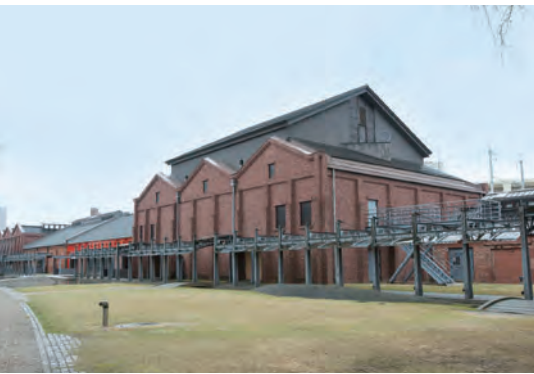
1919年に建てられた紡績工場跡の倉庫を再利用した「金沢市民芸術村」もまた、山出氏の「保存と開発」の成果。365日24時間休みなく運営され、市民は手頃な料金で、演劇、音楽、美術の稽古ができる。