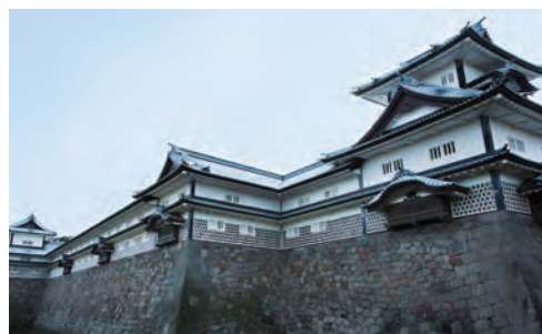
前田家が築いた金沢城は度重なる火災で焼失したが、2001年に写真の「菱櫓」などを復元。その作業には、伝統を継いだ地元の宮大工が力を発揮した。

た地元の方々から聞こえてきたのは、意外にも戸惑いの反応。お客様に対してきちんとおもてなしができているか、との懸念だった。