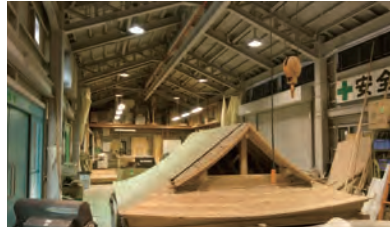
「金沢職人大学校」(下)では伝統文化を支える新たな職人を育成してきた。左は「金沢職人大学校」の内部。ほかにも「金沢卯辰山工芸工房」「金沢美術工芸大学」と、伝統工芸の道を目指す次世代が学ぶための場が多く設けられているのも金沢の特徴だ。