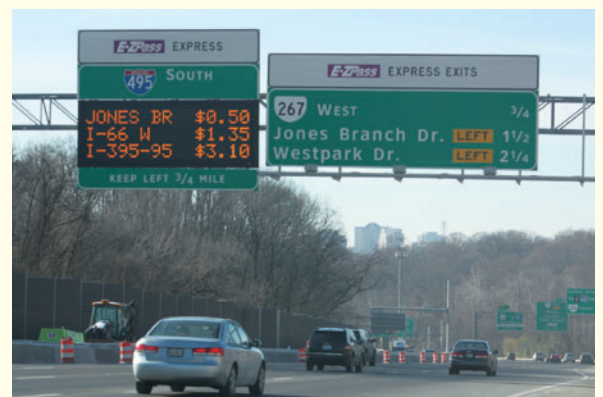
見ている間にも刻々と料金が変わるエクスプレスレーン