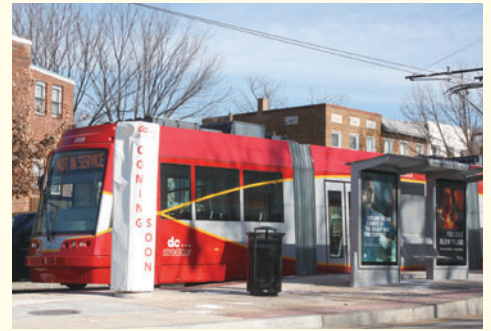
まもなくの開通に向けて試験走行を続ける路面電車