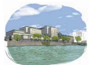
表紙・画 北村公司

日本銀行開業からわずか二カ月後の明治十五年(一八八二)十二月、大阪支店は、日本銀行の初めての支店として開設されました。二度の移転を経て、明治三十六年(一九〇三)から、現在の大阪市中之島に居を構えています。 今回表紙に掲載した現店舗は、大阪のメインストリート御堂筋に面し、大阪市役所と向かい合う旧館とその後方にそびえる新館からなっています。新館建設と明治期に建てられた旧館の復元・改築工事を経て、昭和五十七年(一九八二)に現在の姿となりました。 新館の外壁はポルトガル産花崗石貼り、火炎磨き仕上げ(注)。旧館との調和を重んじて、屋根や窓周りには旧館と同様の銅板を用いたり、旧館側の窓に反射ガラスを使用し、ドーム屋根が美しく映えるような工夫をしています。 その景観維持の取り組みが評価され、昭和五十八年(一九八三)に「第三回大阪都市景観建築賞」を受賞しています。 支店の周囲には川沿いに遊歩道が整備され、土佐堀川・堂島川の川面を眺めながら散策を楽しむ市民に親しまれています。