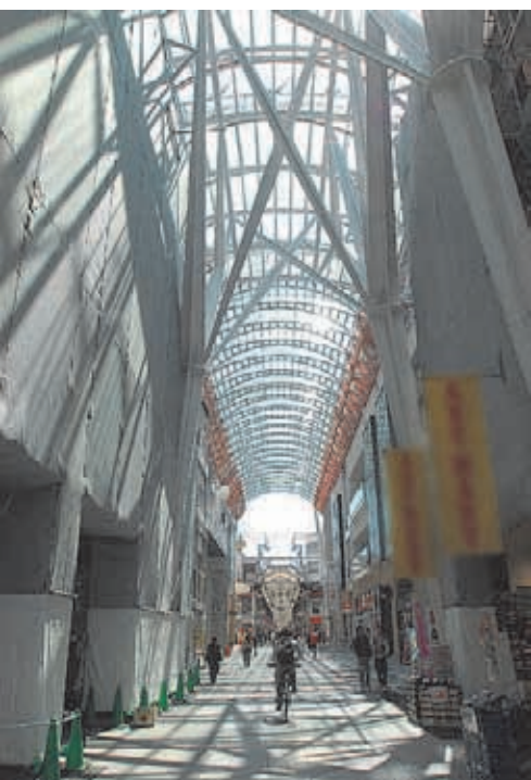
右/クリスタルドーム広場ではさまざまなイベントが開かれ、人々が集う場となっている。上/アーケードの道にもさんと太陽光が降り注いでいた。

「小学五年生の女の子がブランドショップでちゃんと洋服を売ったんですよ。レストランで働いた男の子は自分でドレッシングを作ってサービスして。そういう