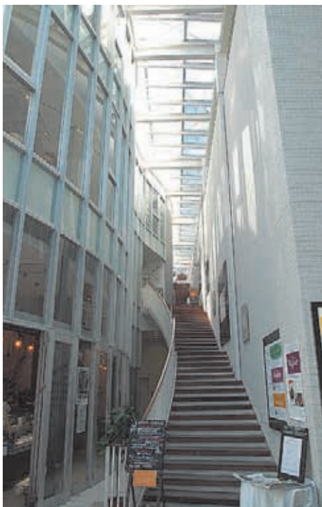
階段を上っていくと、そこにもおしゃれなショップや レストランがあつて一日いても飽きない。そぞろ歩き や発見の楽しみが味わえる設計となっている。

どんな形だったら丸亀町は生 き残れるのか。アメリカのような 町づくりは向かない。ヨーロッパ だ！ とみんなが考えた。小規模 の都市が点在し、町には中心とな る教会などの建物があり緑が豊 か、小さな広場には人々が集うカ フェや店舗がある。そこでは子供 たちがサッカーをして楽しんで いる——。歴史と伝統のある国の、 日常風景である。そこに欠かせな いのは広場プラス市場である。 「この二つが丸亀町には欠けて